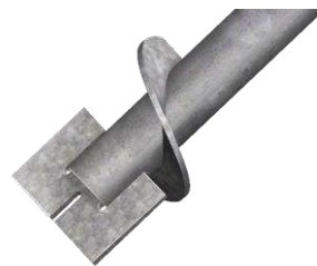
Pata de Cabra

Columnas con diferentes características que brindan estructura y soporte a los macro tuneles. Pueden ser ajustables a las diversas necesidades del mercado. Su acabado puede ser al natural, impermeabilizado o galvanizado. Sus medidas estándares van de 2.00 mts, 2.20 mts, 2.50 mts, 3.00 mts y medidas personalizadas.